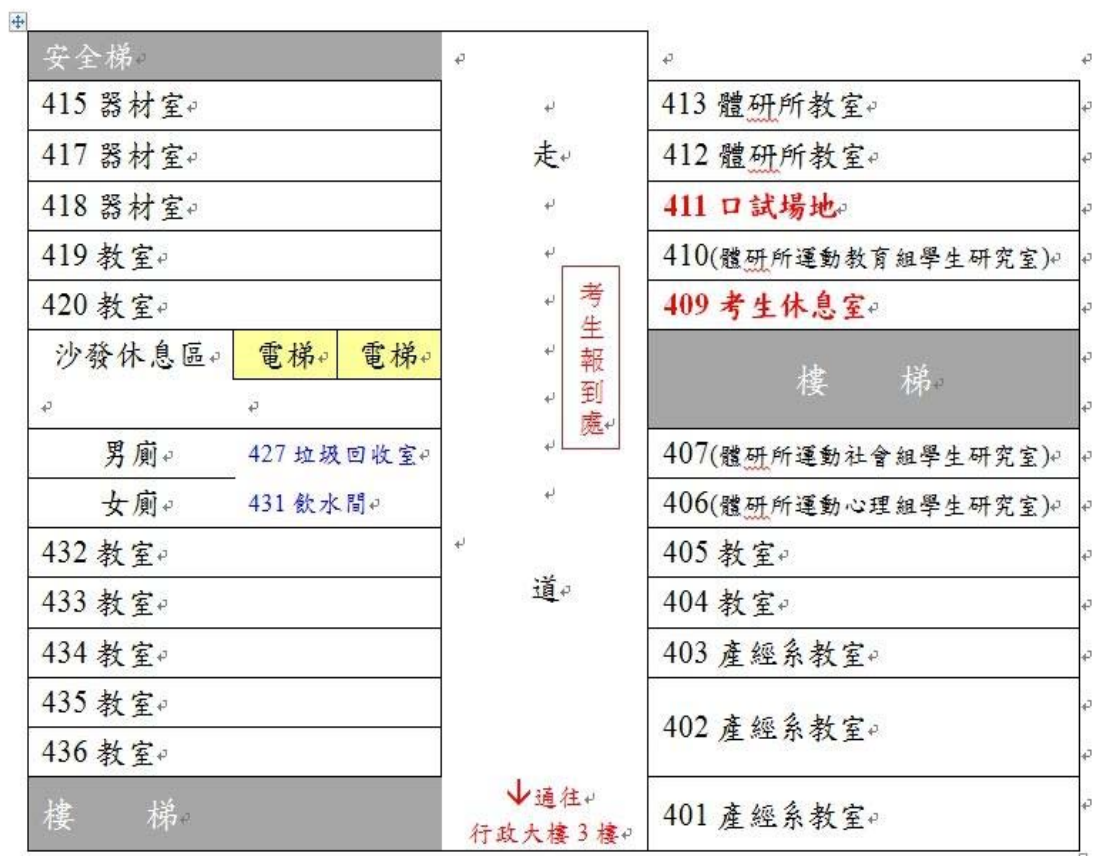
↑ 考試樓層平面圖 (教學研究大樓4樓)