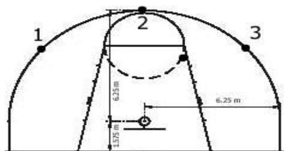
【圖一】籃球計分圖表