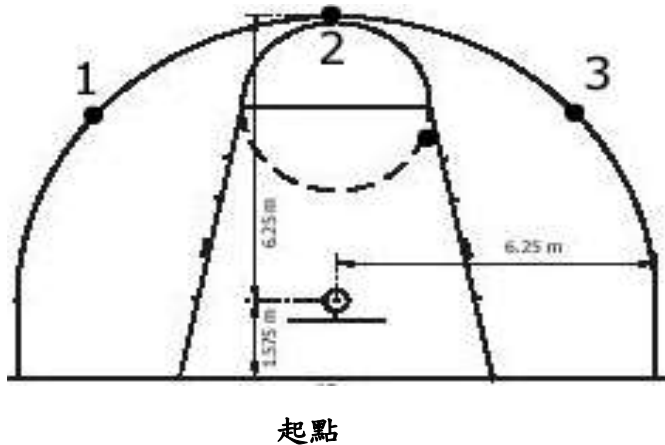
【圖一】 籃球計分圖表